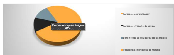
Figura 2. Pontos fortes da utilização dos Blogs Pedagógicos

No que diz respeito a desvantagens da utilização desta metodologia pedagógica, a maioria das respostas evidencia a inexistência de pontos fracos da utilização dos blogs (48%). Os estudantes salientam no entanto o sentimento de falta de conhecimentos informáticos, enfatizando a importância de uma maior proficiência informática (38%), tal como pode ser visto na Figura 3.