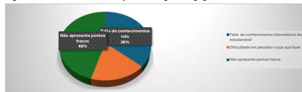
Figura 3 Pontos fracos da utilização dos Blogs Pedagógicos

Estes resultados vão ao encontro dos relatados por Garcia et al. (2019), os quais verificaram que os estudantes percebem níveis mais elevados de aprendizagem ao utilizar blogs pedagógicos na sua aprendizagem. Também Deng & Yuen, (2009), descrevem vários estudos que atestam a eficácia dos blogs, embora existam ainda poucas experiências empíricas e exploratórias sobre a utilização dos mesmos, em contexto educacional (Deng & Yuen, 2009), particularmente no contexto do ensino superior.